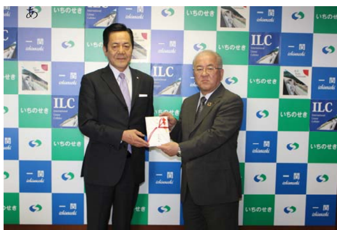
一関市に贈呈（4月28日）

当金庫は、今後も地域社会の繁栄のため、経営理念である「所期奉公（社会貢献）」に努めてまいります。