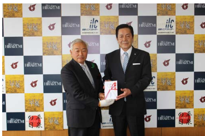
平泉町に贈呈（5月1日）