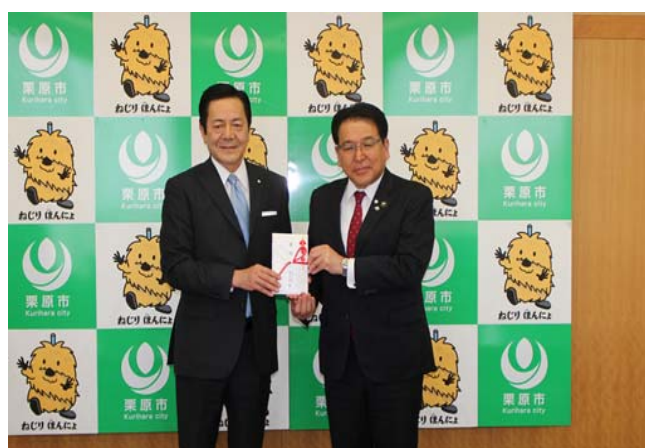
栗原市に贈呈（4月30日）