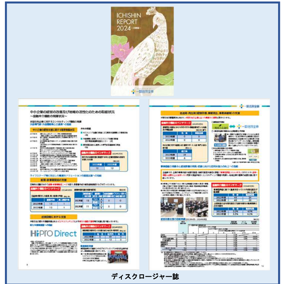
ディスクロージャー誌