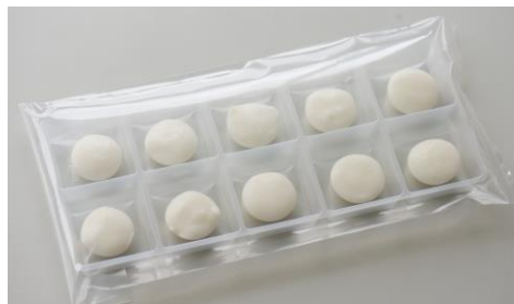
写真：大林製菓(株)「ふわmochi(もち)」